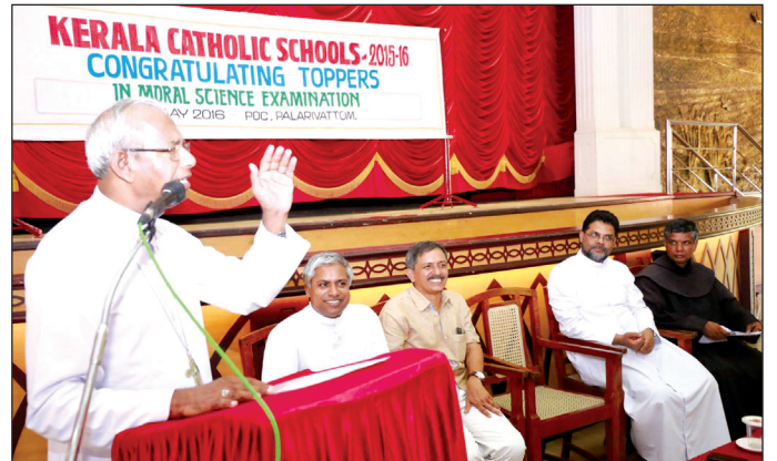
ഉത്തിലെ വിവിധ സ്കൂളുകളിൽ നിന്നായി 148 കുട്ടികൾ അവാർഡിന് അർഹരായി. (കെസിബിസി, ദീപിക, 30/5/2016)